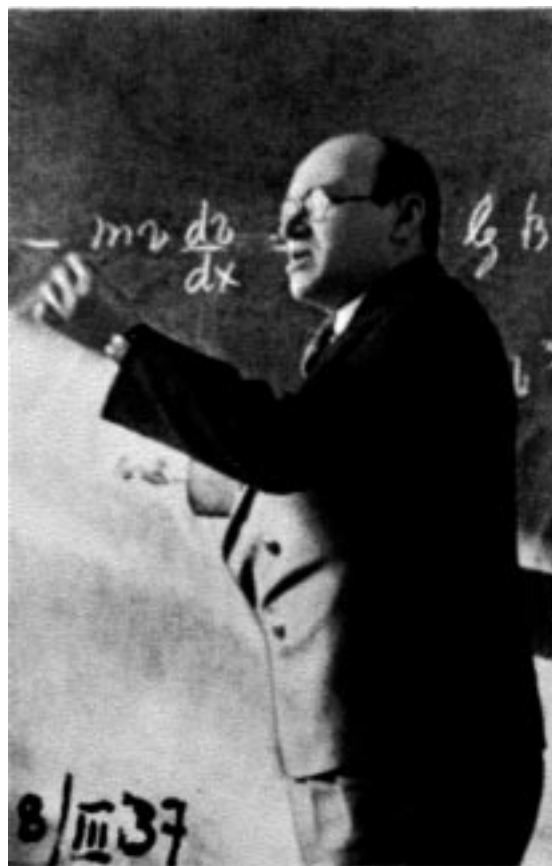
Я.И. Френкель читает лекцию на физико-механическом факультете Ленинградского политехнического института, 8 марта 1937 г.

Эту статью мы снабдим небольшим введением, а также рядом дополнений и комментариев. Они, как нам хочется думать, не окажутся чуждым включением в ее текст и указывают, в частности, на некоторые предшествующие оригинальные работы Френкеля, а также на некоторые дальнейшие направления исследований в этой области физики.