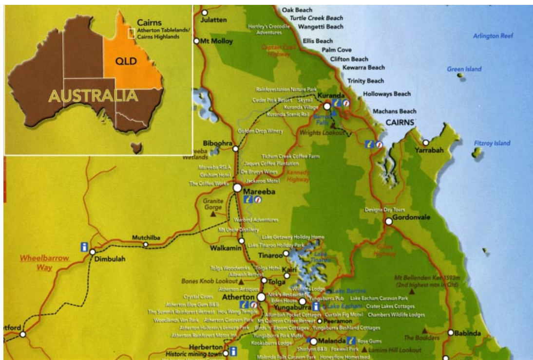
Рис. 2. Фрагмент штата Квинсленд на северо-востоке Австралии, где вблизи местечка Пирамон родился А.М. Прохоров. На вставке в левом верхнем углу — карта Австралии.