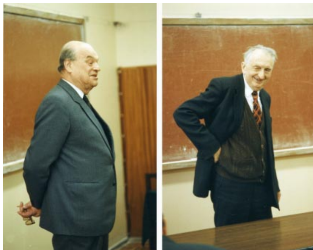
Н.Г. Басов (слева) и А.М. Прохоров (справа) (1996 г.).