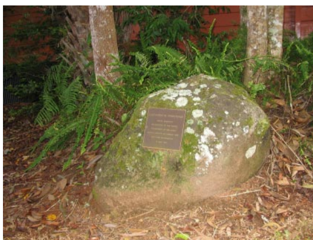
Исследовательский центр тропического леса, где находится мемориальная доска А.М. Прохорова.

Вооруженные такой информацией мы отправились в Пирамон.