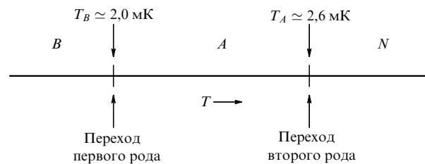
Рис. 1. Фазовая диаграмма жидкого ^3\text{He} при давлении плавления ниже 3 мК.

В более ранних работах корнелльской группы (в то время состоявшей из Дага Ошероффа, Дейва Ли и самого Боба) изучалась кривая сжатия (т.е. график зависимости давления от времени) смеси жидкого и твердого ^3\text{He} и были замечены две небольшие, но повторяющиеся