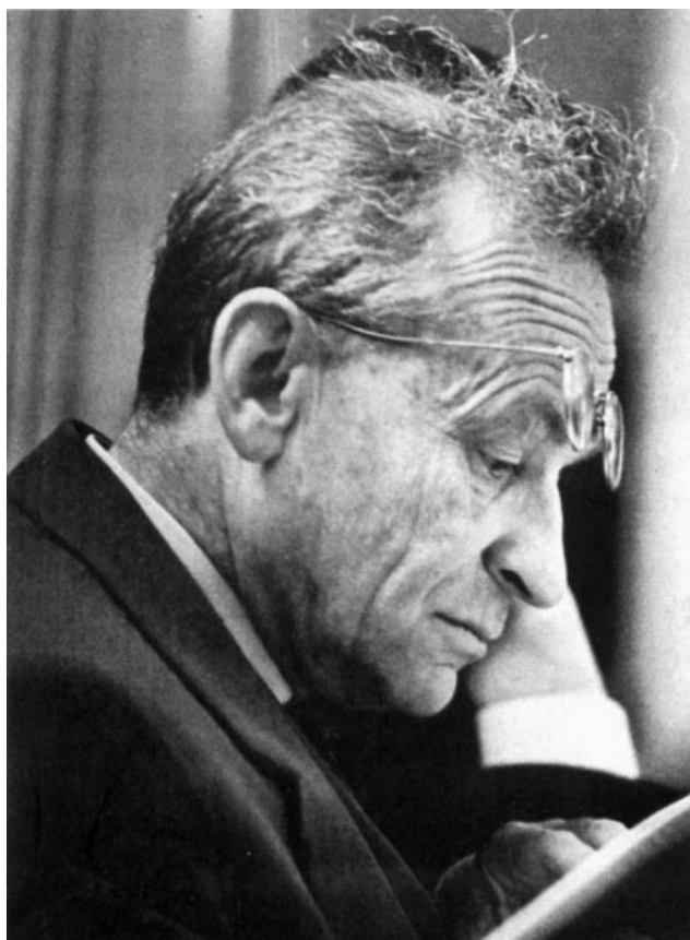
Владимир Иосифович Векслер (04.03.1907 – 22.09.1966)

В Россию Штеренберг вернулся после революции 1917 г. и быстро добился известности, сопровождаемой, правда, модными по тем временам обвинениями в