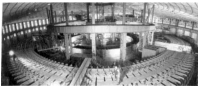
Гигантский ускоритель протонов в Дубне — синхрофазотрон на 10 млрд электронвольт.

В этой связи несколько слов следует сказать и о синхротронном излучении, столь модном сейчас в исследованиях по физике твердого тела, биологии, нанотехнологиям и т.д. Теоретически предсказанное еще в начале прошлого века, оно экспериментально наблюдалось лишь на относительно небольших бетатронах в длинноволновой области спектра. Хотя для В.И. Векслера как ускорительщика синхротронное излучение в первую