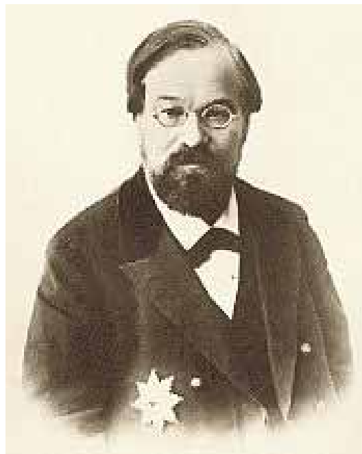
Николай Васильевич Бугаев (02.09.1837 – 11.06.1903)