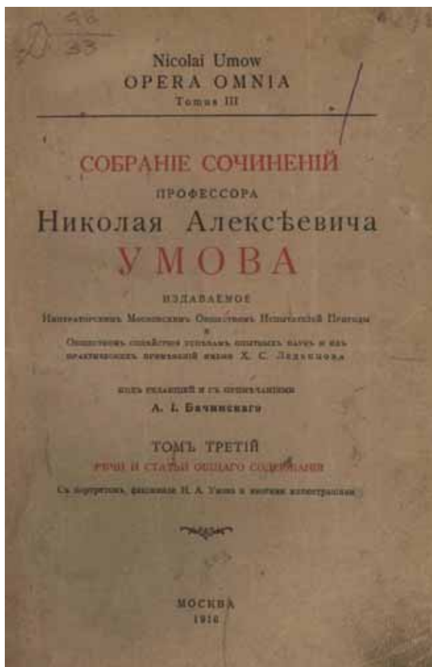
Обложка книги Собрание сочинений Н.А. Умова (М., 1916) т. 3.