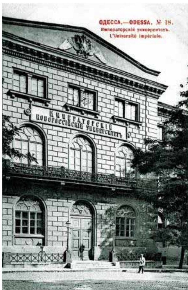
Парадный вход в главное здание Императорского Новороссийского университета (г. Одесса). В этом университете 22 года (с 1871 года по 1893 год) работал Николай Алексеевич Умов.

На следующий год он защитит в Московском университете магистерскую диссертацию Теория термомеханических явлений в твёрдых упругих телах , а по возвращении в Одессу получит в Новороссийском университете экстраординатуру и ординатуру и в итоге станет экстраординарным, а затем и ординарным профессором.