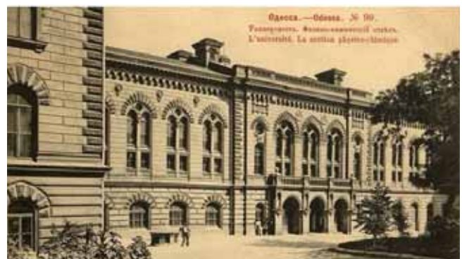
Физико-химический корпус Императорского Новороссийского университета (г. Одесса)

Кстати, во время поездки Умова им была представлена Кирхгофу работа на тему "О стационарном движении электричества на проводящих поверхностях произвольного вида". Кирхгоф решил её для плоскости, Умов же распределение токов на поверхности свёл к распределению токов в плоской пластинке в виде так называемого конформного отображения поверхности на плоскость. Эти выводы Кирхгоф в видоизменённом изложении опубликовал в ежемесячнике Берлинской акаде-