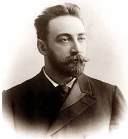
Пётр Николаевич Лебедев (08.03.1866 – 14.03.1912)

В 1911 г. в знак протеста против реакционной политики Л.А. Кассо известные профессора Московского университета Н.Д. Зелинский, А.А. Эйхенвальд, В.И. Вернадский, К.А. Тимирязев, С.А. Чаплыгин покинули университет, и среди первых покинули его Н.А. Умов и