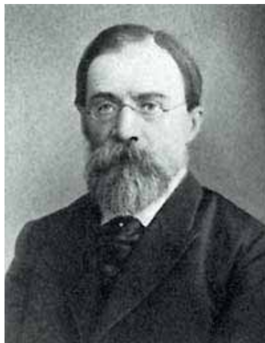
Александр Григорьевич Столетов (10.08.1839 – 28.0.1896)

связанный с механикой сплошной среды и с теорией упругости [2, с. 158].