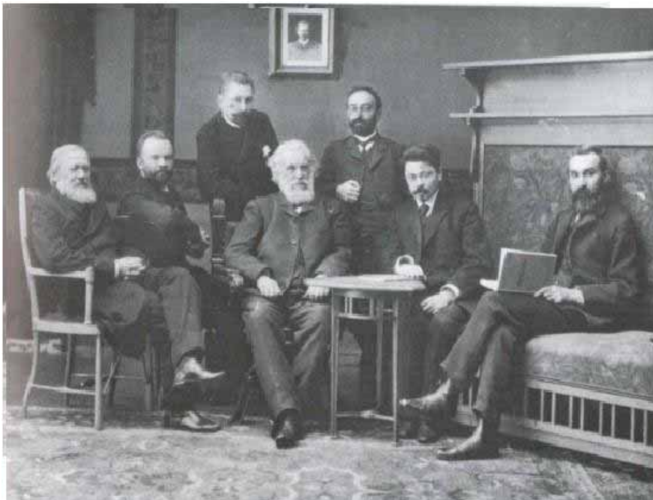
Группа членов редакции журнала "Научное слово" (1905 г.). В центре сидит Н.А. Умов.

рии физических наук" (1896), "Мысли об естествознании" (1900), "Эволюция атома" (1905), "Характерные черты и задачи современной естественнонаучной мысли" (1911), "Культурная роль физических наук" (1912), "Физические науки в служении человечеству" (1913), "Эволюция физических наук и её идейное значение" (1914) и другие, положительно воспринятые соотечественниками.