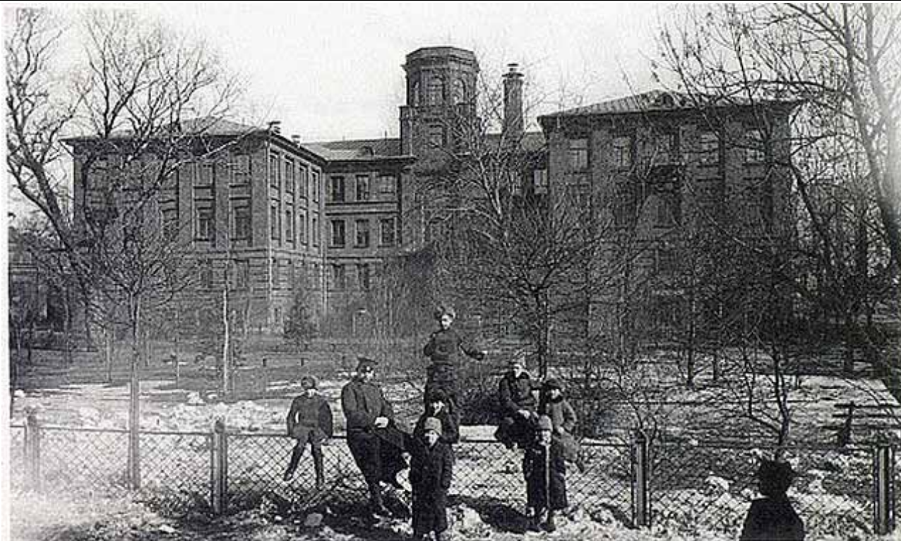
Физический институт (1903–1922) — научный институт при физико-математическом факультете Московского университета, в создании которого принял участие и Н.А. Умов.

Вместе с тем, Умов продолжает свои собственно физические исследования. Причём, если работы по механике, оптике, термодинамике и электричеству были выполнены им чисто теоретически, и в этой ситуации он проявляет себя как блестящий теоретик, то с 1896 г. он обращается также к эксперименту: исследует диффузию веществ в водных растворах, поляризацию света в мутных средах, обнаруживает эффект хроматической деполяризации лучей света, падающих на матовую поверхность.