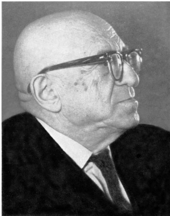
Эдуард Владимирович Шпольский (23.09.1892 – 21.08.1975)

Организатором и редактором УФН, указанным на обложке журнала, до тома 3 включительно был Петр Петрович Лазарев (14.04.1878 – 24.04.1942). Изданный в 1924 г. том 4 содержал уже 6 выпусков. Его редакторами были П.П. Лазарев и наравне с ним на обложке журнала появляется Э.В. Шпольский. В дальнейшем журнал выходил ежегодно (за исключением самого тяжелого периода Отечественной войны). Последним предвоенным выпуском УФН явился том 25, вып. 3, подписанный в печать 17.06.41, и уже 10.07.43 был подписан в печать том 26, вып. 1.