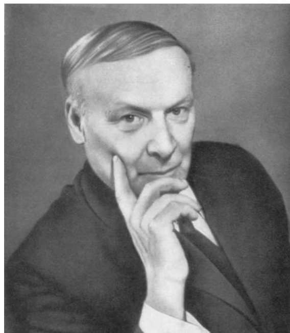
Евгений Константинович Завойский (28.09.1907 – 09.10.1976)

В 1993 г. УФН отметил свое 75-летие. Это было сделано в такой форме: апрельский выпуск журнала за 1993 г. (УФН 163 (4) 1993) был, после краткого замечания от редколлегии, целиком посвящен перепечатке 10 статей советских физиков, опубликованных в довоенное время в УФН и не изданных за рубежом. Как было указано в предисловии от редакционной коллегии: "Эти статьи представляют не только исторический интерес. Многие направления физики, вошедшие сейчас в учебники, излагаются специалистами, которые их создавали. Поэтому представленный в статьях анализ и рассуждения авторов позволяют восстановить глубину проблемы, которая в современных учебниках часто теряется. Таким образом, представленный материал будет полезен для специалистов и вместе с тем